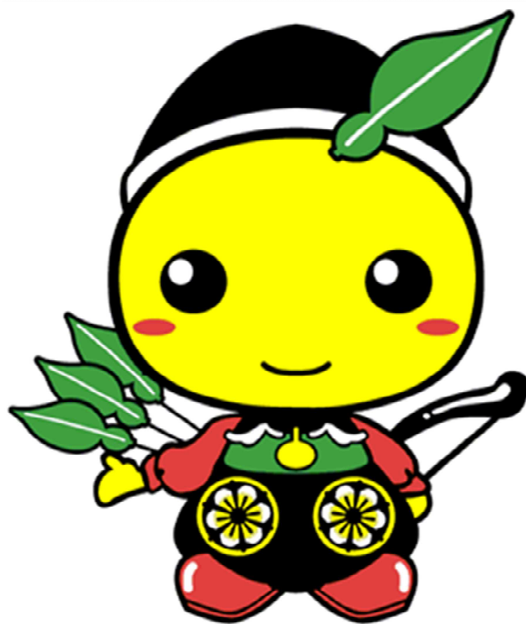
毛呂山町マスコットキャラクター もろ丸くん