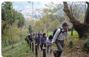
ハイキング大会(越生町)