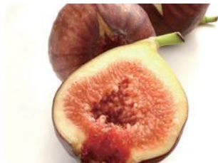
KJブランド認承品・いちじく(川島町)