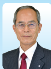
川島町長 飯島 和夫