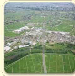
圏央道川島IC(川島町)