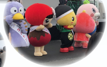
レインボーまつりin川越(川越市)