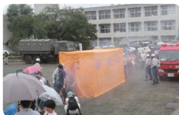
防災訓練(鶴ヶ島市)