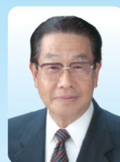
越生町長 新井 雄啓