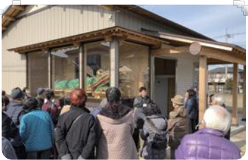
レインボーバスツアー(鶴ヶ島市)