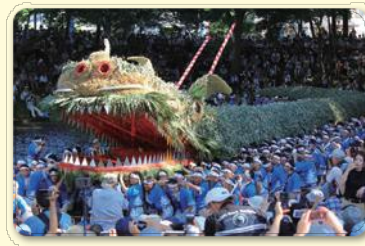
脚折雨乞(鶴ヶ島市)