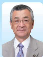
川越市長 川合 善明