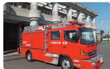
川越地区消防組合(川越市・川島町)