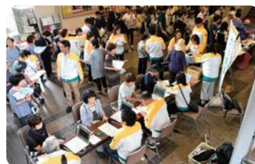
健康チェック体験(坂戸市)