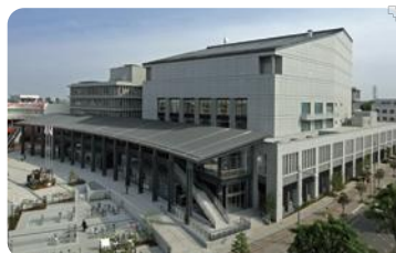
ウエスタ川越(川越市)