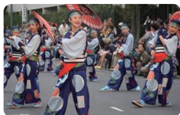
坂戸よさこい(坂戸市)