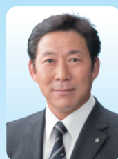
毛呂山町長 井上 健次