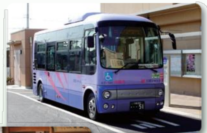
市内循環バス(川越市)