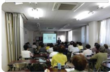
大学連携講座(坂戸市)