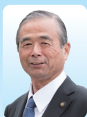
鶴ヶ島市長 齊藤 芳久