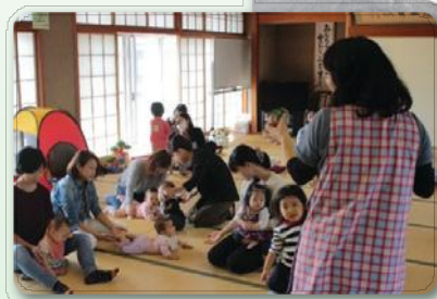
子育てサロン(川島町)