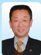
坂戸市長 石川 清