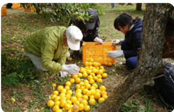
ゆず採りボランティア(毛呂山町)