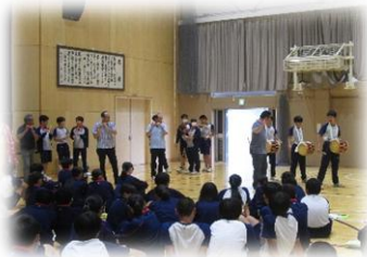
↑ 川角獅子舞を体験する様子

6月18日(木)、川角地区の獅子舞保存会の方々から獅子舞の歴史や現在直面している課題、歴史民俗資料館の方から、鎌倉街道上道の歴史的価値をお話していただきました。毛呂山町が大事にしているものを、どのように後世に伝えていくか、今後の探究の時間で学びを深めてほしいです。