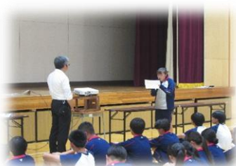
↑ 講義のお礼を述べる3年生