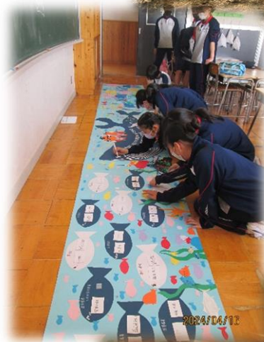
仮入部で1年生に丁寧に 教える上級生