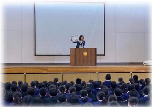
1年生 校外学習 の一場面

また、今後の部活動の朝練習の変更についても話しました。学校総合体育大会や吹奏楽コンクール後には、朝練習をどの部活動も実施しないこととなります。詳しくは別紙のお知らせをご覧ください。