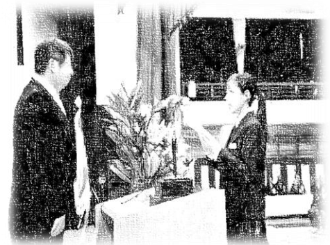
新入生誓いのことば