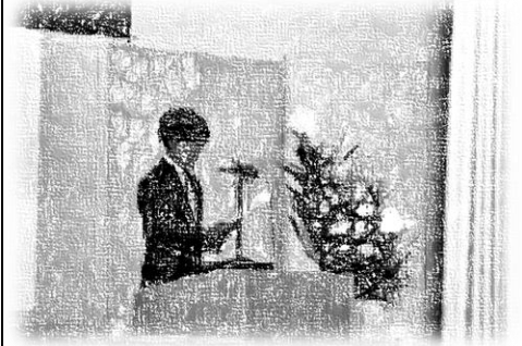
在校生歓迎のことば

<令和8年度第80回入学式> 4月8日(水)100名の新入生を迎え、第80回入学式が挙行されました。新入生誓い・在校生歓迎のことばを紹介させていただきます。