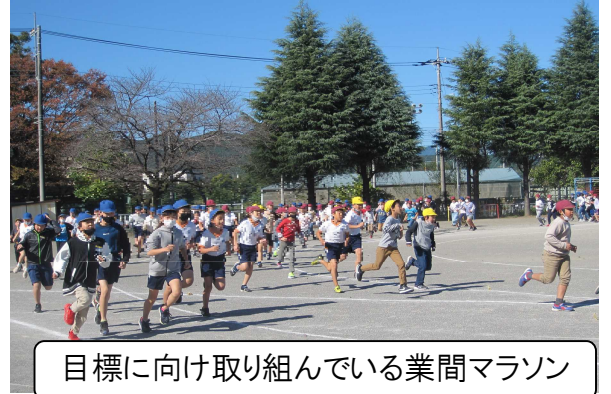
目標に向け取り組んでいる業間マラソン

2学期もあと3週間ほどとなりました。子供たちのさらなる成長に向け、丁寧にまとめをまいります。