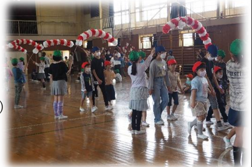
「1年生を迎える会」より

※新型コロナウイルスの感染状況や国の対応策等により変更がある場合は、メールにてお知らせいたします。