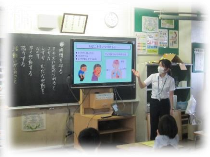
3年生 「保健教室」…埼玉医科大学