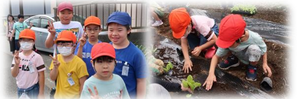
なかよし 「小中合同作業」…川角中・学校77-6