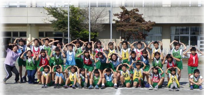
6年生 「スポーツ交流会」…川角小学校