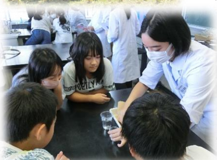
6年生 「お薬教室」…城西大学