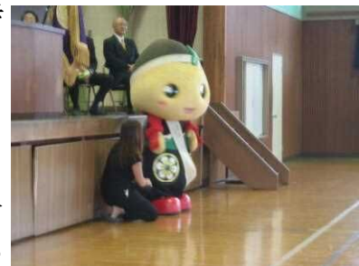
特別ゲスト もろまるくん

最後は、「タイムカプセル」の埋設です。10年後の自分に向けて書いたメッセージカードを、児童代表と実行委員会の皆さんで埋めました。このカプセルは、10年後の令和15年に掘り出す予定です。