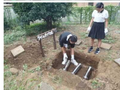
中庭の一角に埋設