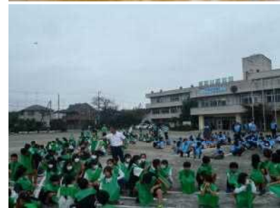
人文字で校章を描きました