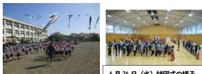
4月24日(水) 結団式の様子

今年度もすくすくタイムが始まりました。5分間、自分の目標やペースに合わせてながら、精一杯走ります。また、5月25日(土)に開催する運動会の応援団が決まり、その練習も始まりました。