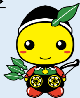
毛呂山町マスコットキャラクター もろ丸くん