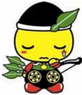
毛呂山町マスコットキャラクター もろ丸くん

学校に行きたくない・学校に行けない クラスになじめない いじめや友人関係の悩み 将来のこと（進路や学習についての不安） 非行や反抗、暴力などの問題行動 発達の遅れや障害などに関すること しつけが身につかない