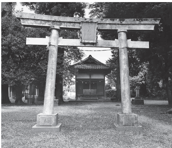
境内に市神様を祀る市場神社

市場の八坂神社は、往来が盛んだった鎌倉 街道上道の高麗川渡河点付近の賑わいと市場 の由来そのものを伝える貴重な歴史遺産とい えます。