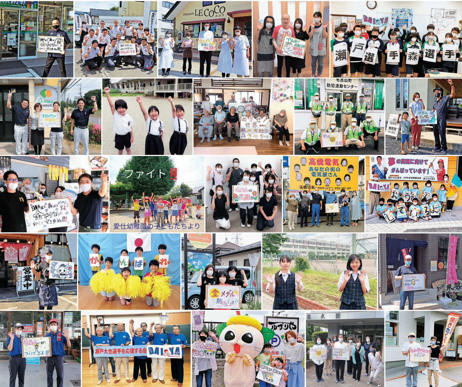
両選手への応援メッセージ動画を7月中旬頃に町公式YouTubeチャンネルで公開します。