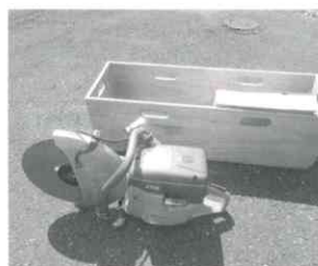
エンジンカッター