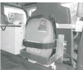
AED(自動体外式除細動器)

眩しい真紅の車両である新型のポンプ車で、各団員は定期的に訓練を重ね、知識向上と操作方法に1日も早く慣れるため、心新たに消防団活動によりいっそう励む心構えとなっております。