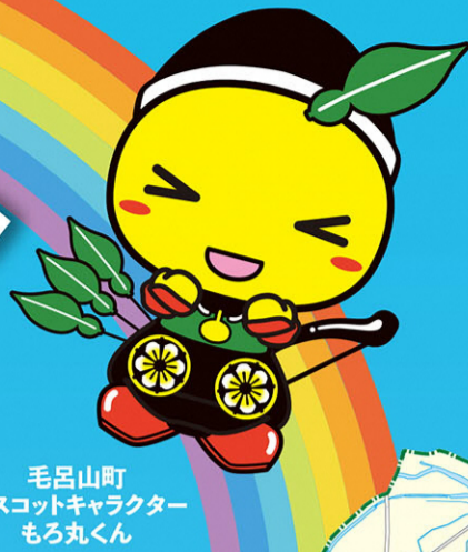
毛呂山町 マスコットキャラクター もろ丸くん