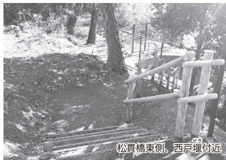
松貫橋東側、西戸堰付近