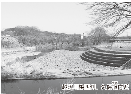
越辺川橋西側、久保堰付近