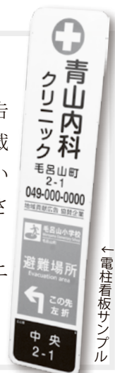
←電柱看板サンプル