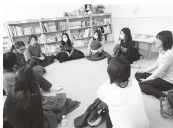
▲ママだけでゆっくり『おしゃべり』

参加した人は、「年の近い子どもがいる人と悩みが共有できた」と言い、先輩ママからのアドバイスや失敗談で盛り上がりました。