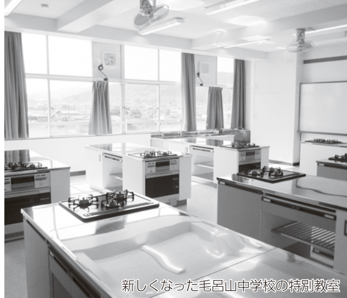
新しくなった毛呂山中学校の特別教室

平成 29 年度より、町立小・中学校の授業が、現在の二学期制から「新三学期制」に変わります。これまでの二学期制の良さをいかながら新三学期制を実施しますので、ご理解とご協力をお願いします。