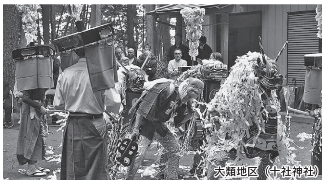
大類地区 (十社神社)