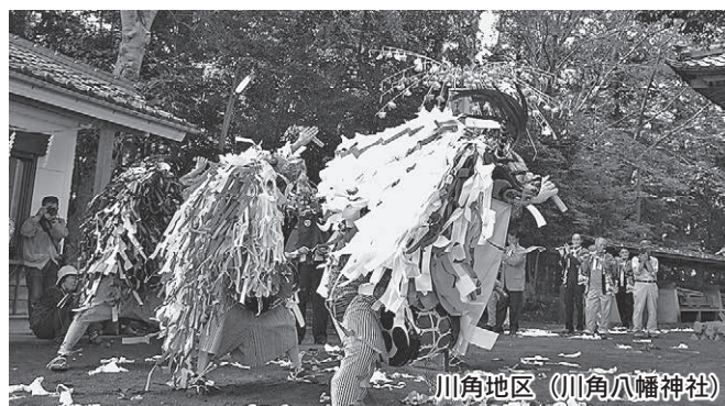
川角地区 (川角八幡神社)