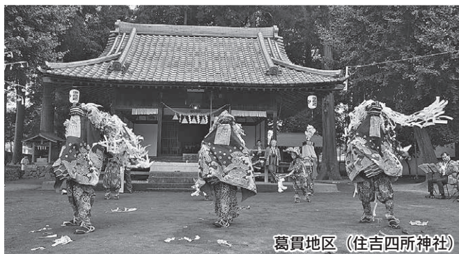
葛貫地区 (住吉四所神社)

10月11日に葛貫・滝ノ入・大類地区で、18日に川角地区で獅子舞が奉納されました。毛呂山町の獅子舞は、地区ごとに受け継がれ、地域信仰として守られています。今年も華やかに舞が奉納されました。