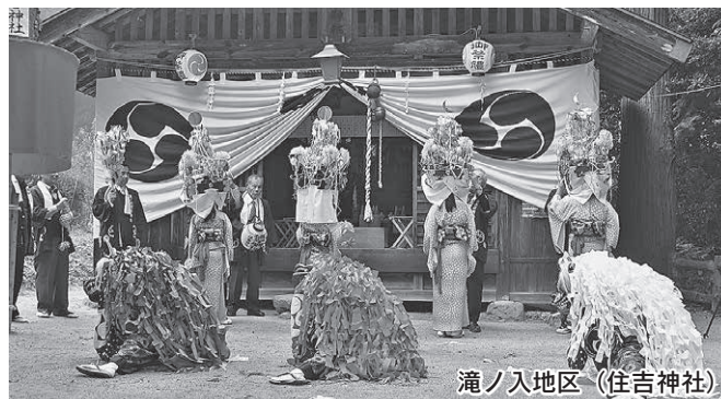
滝ノ入地区 (住吉神社)