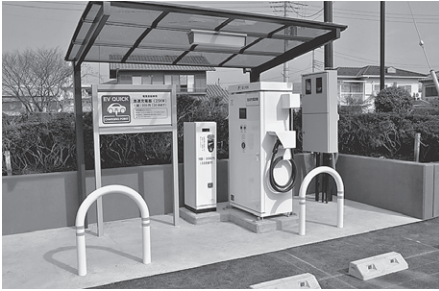
☎ 役場生活環境課環境係 ☎ 内線 211・212

電気自動車の普及促進を目的として、役場北側駐車場に電気自動車用急速充電器（25kw）を設置しました。24時間利用可能で、利用料金は30分300円です。