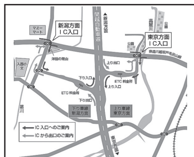
スマートインターチェンジ周辺拡大図