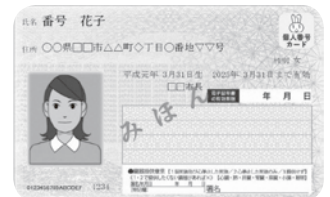
個人番号カード（表）イメージ