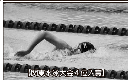
【関東水泳大会4位入賞】