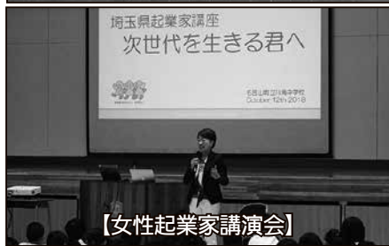
【女性起業家講演会】