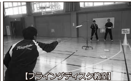
【フライングディスク教室】