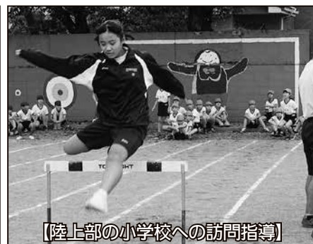
【陸上部の小学校への訪問指導】