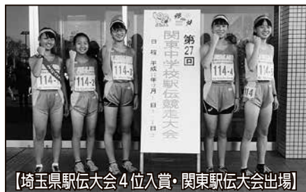
【埼玉県駅伝大会4位入賞・関東駅伝大会出場】