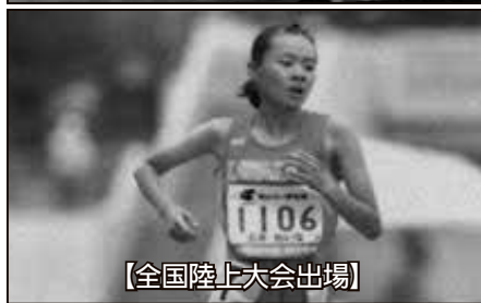
【全国陸上大会出場】