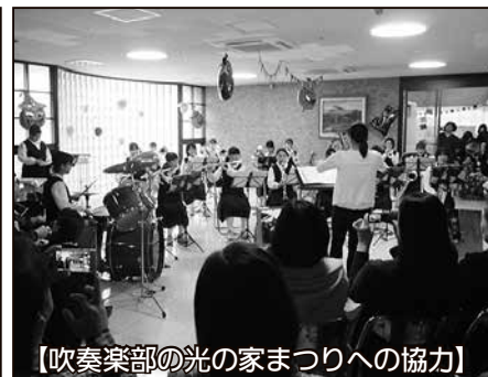
【吹奏楽部の光の家まつりへの協力】