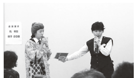
認知症に役立つ法律