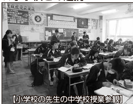
【小学校の先生の中学校授業参観】