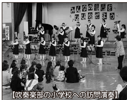
【吹奏楽部の小学校への訪問演奏】