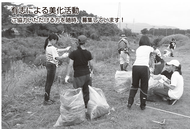
有志による美化活動

その他、日常の維持管理や美化活動ボランティア等については役場まちづくり整備課道路工務係までお問い合わせください。