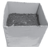
ダンボール式コンポスト