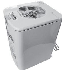
電気式家庭用生ごみ処理機

※なお、ダンボール式コンポストの容器・発泡スチロール式コンポストの容器や資材は無料で差しあげます。