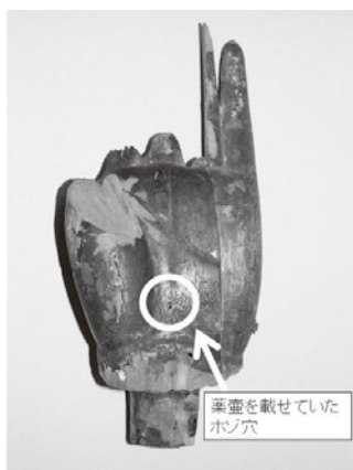
桂木寺伝釈迦如来坐像造像 当初の左手

現在、歴史民俗資料館では、特別展「山・寺・ほとけ」毛呂山の仏教文化と修験」を12月16日(日)まで開催しており、実物をご覧になることができます。