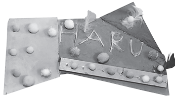
「ふわふわ自分かぎかけ」