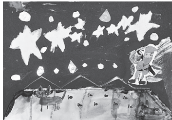
「ひめをたすけに今、行くぞ。」