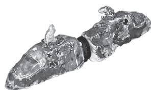
「とぶしんかんせん」 (マグネットマスコット)