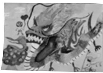
「オーロラが 龍のうろこにうつる」