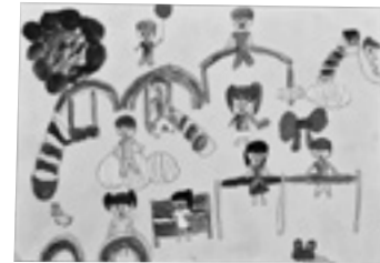
「くもとのじの カラフルこうえん」