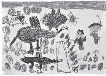
「きょうりゅうとあそんだよ」