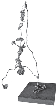
「ねじり つひおりたバンジー」