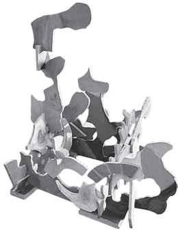
「ふしぎな世界のゆうえんち」