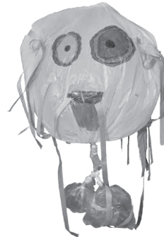
「かみながゆうれい」