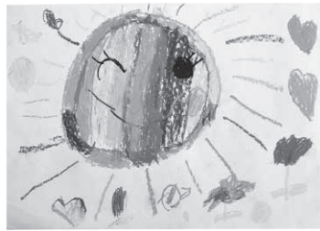
「おひさまがわらっているよ」