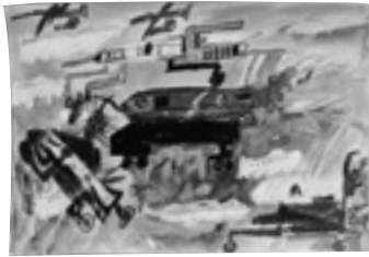
「くもの国に むかうせんとうき」