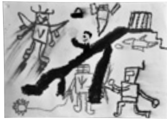
「こんなところに ロボットが」