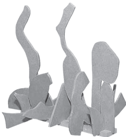
「なんの かたちかな」