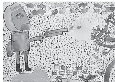
「まのいいりょうし」