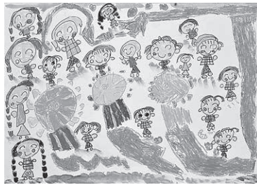
「あさがおランドであそんだよ」