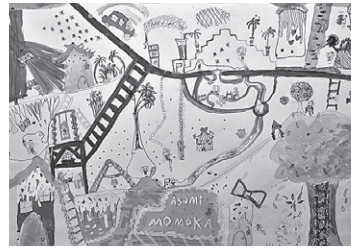
「おかしの国の休み時間」