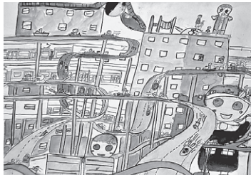
「もろ丸サーキット」