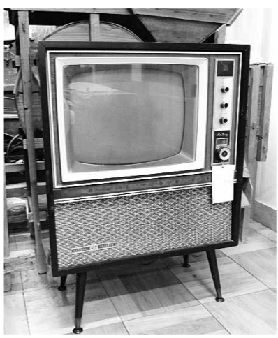
昭和30年代のテレビ

2月9日から始まる平昌オリンピックは、世界中から集まる選手たちの競技に多くの人が注目しています。現在では、パソコンやスマートフォンなどの様々な機器で競技映像を目にする事ができますが、テレビで観戦を楽しむ人は今も多いのではないのでしょうか。 スポーツ中継とテレビのつながりは、日本でテレビ放映が始まった昭和28年(1953)にまでさかのぼります。この年の2月1日から本格的な放送が開始されたテレビ放送は、5月からは大相撲中継が、8月からは高校野球中継とプロ野球中継が加わり、スポーツ中継番組を増やしていきました。そして、翌年2月からプロレス中継がスタートすると人々はテレビに夢中になっていきました。