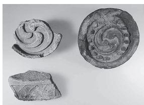
出雲伊波比神社 左 2点：鎌倉時代の軒丸瓦と軒平瓦 右 上：戦国時代の軒丸瓦

それを遙かに遡る鎌倉時代後期、13世紀後半から14世紀初頭頃に位置づけられる「比企型」とよばれる瓦が含まれていることが判りました。比企地域の都幾川流域を中心に分布する中世の瓦です。神社の縁起を記した『臥龍山宮伝記』には、源頼朝が畠山重忠に命じて本殿を檜皮葺に造営したとの記載が見られますが、鎌倉時代に瓦葺にしたという記載は見られませんので、新たな発見です。 また、寄託資料のうち戦国時代の瓦のなかには「道具瓦」と総称される瓦(屋根の棟に積まれた熨斗瓦と思われる瓦など)も確認されました。さらに、軒の隅を飾った瓦も確認されており、戦国時代、16世紀の前半頃には屋根の全体を瓦で覆った総瓦葺の荘厳に満ちた社殿があつたものと思われれます。 毛呂氏の氏神として中世毛呂郷を象徴し、連綿と今に続く流鏝馬を伝えるこの神社の歴史の重みや奥深さを改めて知ることができる資料といえます。 歴史民俗資料館でただ今開催中の企画展『戦乱の世の文化財―指定文化財を中心に毛呂山の中世をしのぶ―』では、新たな発見と展示しています。この機会にぜひご覧いただき、改めて毛呂山の中世をしのんでみてはいかがでしょうか。うか。