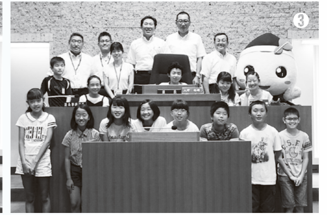
①毛呂山小学校 ②川角小学校 ③光山小学校 ④泉野小学校