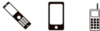
携帯電話 スマートフォン PHS

※携帯電話・スマートフォン専用回収ボックスを 設置して下さる商店や会社を募集しています。 詳しくは役場生活環境課までお問合せください。