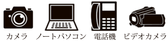
カメラ ノートパソコン 電話機 ビデオカメラ