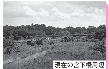
現在の宮下橋周辺

本図面は整備イメージを示したものです。 詳細な調査、設計は今後のため、内容は変更となる場合があります。