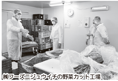
(株)フーズニジユウイチの野菜カット工場

また、三和(さんわ)タジマ(株)の北側にも企業進出が聞えてきており、今後2年以内には進出企業の詳細が説明できるものと期待しております。