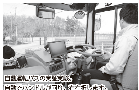
自動運転バスの実証実験。自動でハンドルが回り、右左折します。

結びに、いよいよ2020東京オリンピック・パラリンピックを迎える年。本町では「東京2020オリンピック・パラリンピック毛呂山町出身選手支援会」を立ち上げ、競泳の瀬戸大也選手と女子ソフトボールの森さやか選手の活躍に期待をしております。