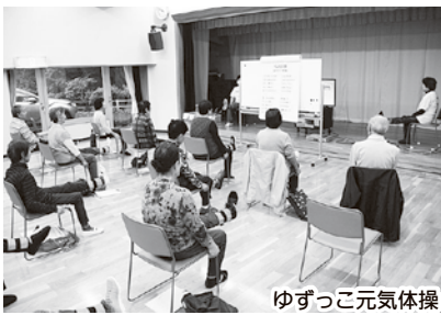
ゆずっこ元気体操

「医療と福祉の町」という埼玉医科大学と本町との連携したまちづくりの代表的な施策として、地方創生推進交付金を活用して整備された「くらしワンストップMOROHAPPINESS館」では、フィットネスによる介護予防や、在宅療養における終末期医療、看取りを支える在宅医療・訪問看護など、県内でも