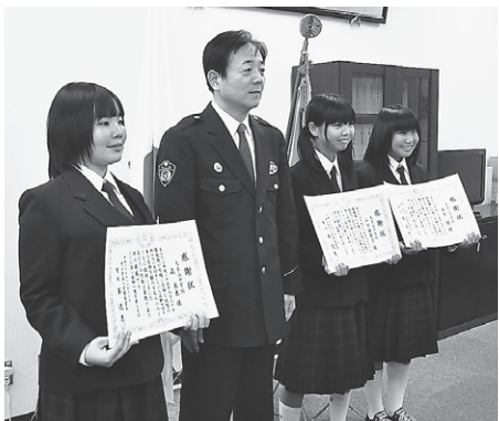
西入間警察署から感謝状を受けとる毛呂山中学校生徒

結びに、皆さまが健康で幸せな1年でありますようお願いし、新年のごあいさつとさせていただきます。