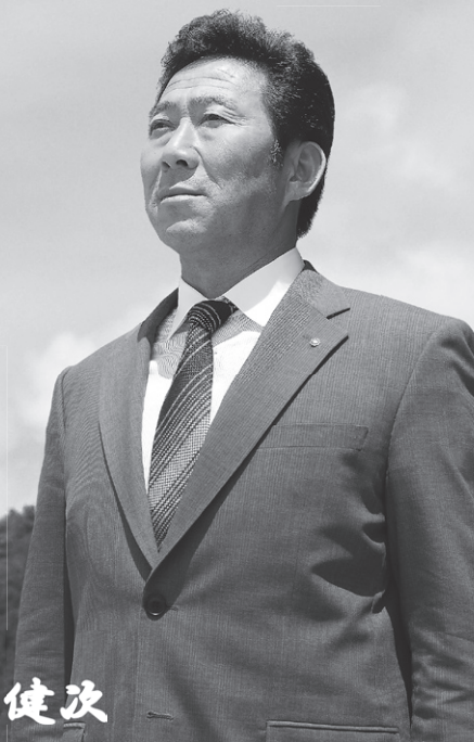
毛呂山町長 井上 健次

もつといい町へ 手と手をたずさえ信頼関係を築きます 思いやりあふれる優しいまちへ 安心安全な暮らしを守ります