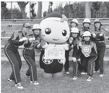
全国大会で銅メダルを獲得した女性消防隊