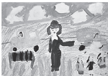
「あんぜんあんしんに くらせるくに」