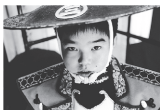
第21回グランプリ作品