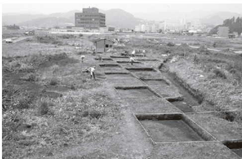
伴六遺跡の発掘調査風景と毛呂山町役場 (昭和57年)

開発が進んだ現在、伴六遺跡周辺で平安時代の風景を探すことは難しくなつてしまいました。が、歴史民俗資料館で開催中の企画展「毛呂山町遺跡調査60年のあゆみ」では、伴六遺跡調査時の写真や伴六遺跡をはじめとした毛呂山町の平安時代の遺跡について紹介しています。