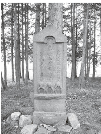
オトカ山に今も立つ庚申塔(延宝4年・1676年、大類グラウンド南側)

毛呂山にも昭和20年ごろまではキツネに化かされたとか、キツネ火を見たという伝承がこちらに伝わっていました。いくつかの伝承をご紹介します。 川角と大類の境に「オトカ(榎荷)山」と呼ばれる森があります。歴史民俗資料館西側の鎌倉街道周辺と大類グラウンド付近一帯のことで、そこにはこんな伝承が残っていました。 「〇ちゃんが夜分に大類の北はずれ、庚申様の石塔がある大きな松の近くを通ると人間ぐらいの大きな白いキツネが前を横切った。すると自転車はどこに置いたかもわからなくなり、道に迷った。家に戻ったときは傷だらけだった。」 キツネと出会い、道が急にわからなくなり、同じところをさまよったという話は他にも市場や西大久保、岩井西など広く町内で語られていました。なかにはキツネが知り合いに化けて持っていた川魚の天ぷらを盗まれたという話もあります。 また、合わせてキツネ火を見たという伝承も多く残っています。