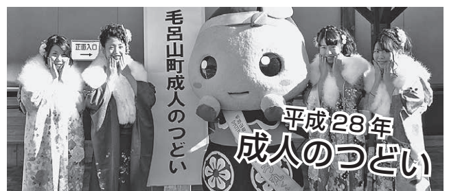
毛呂山町成人のつどい