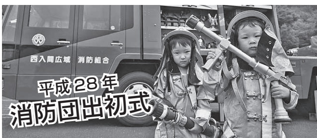
平成28年 消防団出初式

小さなお子さんも楽しめる内容も盛りだくさんのイベントです。ぜひご家族そろってご来場ください。