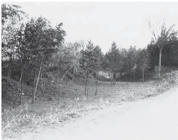
大正時代の市場の掘割遺構

いにある福祉施設の辺りは「鎌倉道」と呼ばれており、平成8年度の福祉施設建設に伴う発掘調査では、8世紀頃の古墳2基が発見されました。このとき古墳は発掘調査後に壊されましたが、敷地内の掘割遺構は、福祉施設の協力によって現状のまま保存されています。 また、東側の山林の中には、同時期のものと考えられる塚が点々と確認でき、中には大刀 たち が出土した塚もあります。 鎌倉街道上道の葛川渡河点周辺は、古墳時代の古墳や平安時代のムラの跡が発見されていますが、中世のムラや寺院の跡はわずかに口伝 くでん を残すのみです。しかし、掘割遺構は鎌倉街道上道の特徴を埼玉県内で最も良く観察できる場所であり、将来にわたって残していきたい遺跡です。