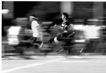
撮影場所／大類グラウンド