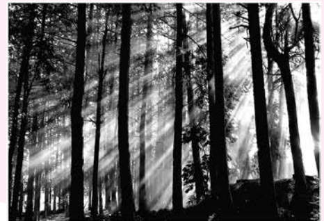
風景・自然の部 優秀賞