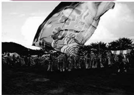
撮影場所／総合公園

対象作品 平成 30 年中に毛呂山町内で撮影したカラー写真 (四つ切・四つ切ワイド・A4) 応募期間 平成 30 年 11 月 27 日 (火) から平成 31 年 1 月 15 日 (火) まで 主催・問合せ 中央公民館 ☎ 049 (294) 1250