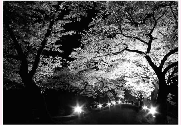
風景・自然の部 最優秀賞