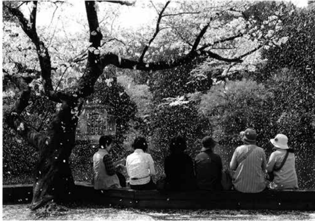
風景・自然の部 最優秀賞