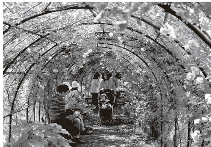
撮影場所／滝ノ入口スカーデン