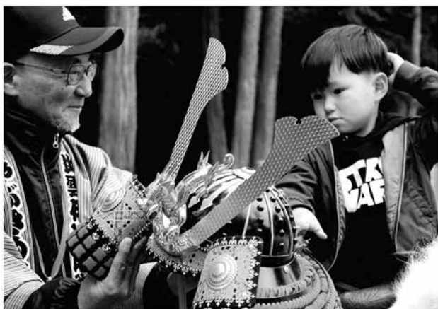
流鏝馬の部 最優秀賞