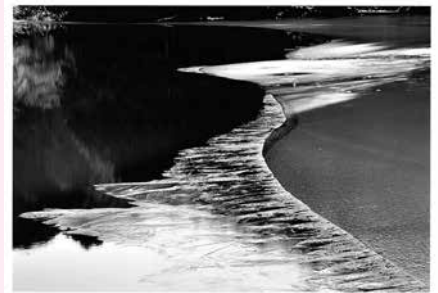
風景・自然の部 優秀賞