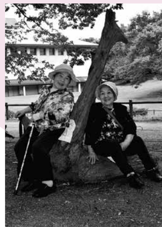
撮影場所／総合公園