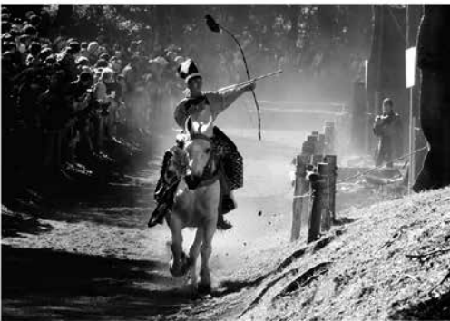
流鏝馬の部 優秀賞