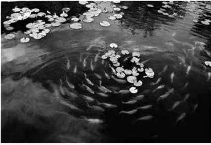
風景・自然の部 優秀賞