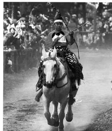
流鏝馬の部 優秀賞