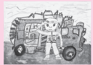
「いつも町を守ってくれる消防」